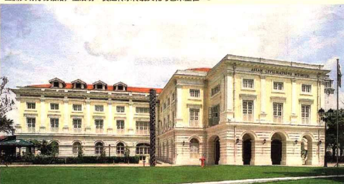
皇后坊的亚洲文明博物馆有两处馆址，一在旧道南学校内，一在皇后坊。