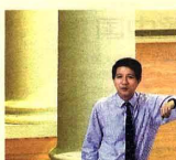
“亚米尼亚街的亚洲文明博物馆翻新后将以土生华人文化为展览主题，土生华人文化是东南亚多种文化的融合，反映了新加坡文化独特的一面。”——亚洲文明博物馆馆长郭勤进博士

皇后坊本来要作为法庭用途，后来却成为多个政府部门的办事处。新加坡独立后移民厅、生死注册局和国民登记局就设在这里。事实上几乎所有有成年新加坡人，都把脚印印在这座古老的建筑物内。