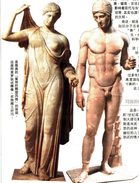
这是雅典娜女神的雕像，是雅典的“守护神”的体现。

报道 莫美颜 图片 Musée du Louvre D. Lebec and C. Déambrosi