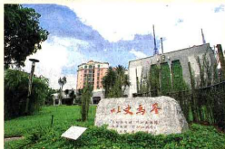
资鉴馆花园里摆放“以史为鉴”石刻，石刻旁栽种了44株胡姬花。