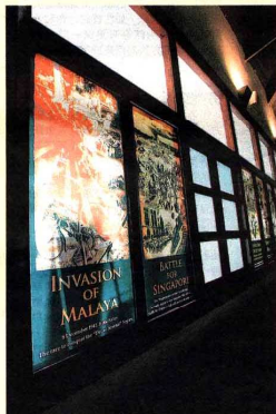
把招贴贴在透光的玻璃窗上，借助阳光，招贴上的文字明显可辨。