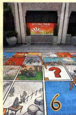
资鉴馆院子内的“蛇与梯”棋盘。

“和平”雕塑则摆放在花园的另一角落，与“以史为鉴”石刻并列，象征战争结束后的宽恕与平和。