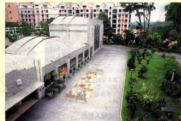
厂，也是武吉知马路段一个显赫的地标。10月正式启用时是当时东南亚首个汽车装配厂，也是武吉知马路段一个显赫的地标。10月正式启用时是当时东南亚首个汽车装配厂，也是武吉知马路段一个显赫的地标。