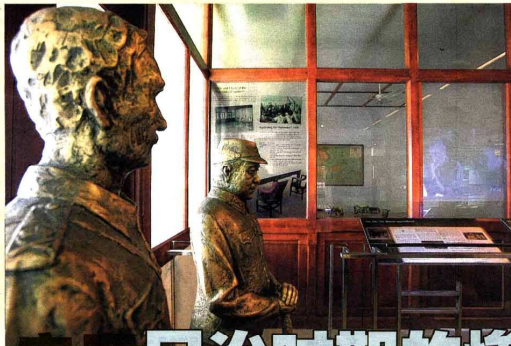
玻璃墙内是英军签署投降书的会议室。

坡路在二零零八年八月一这段历史，让参观者从中了解二战时期和沦陷时期本地人的生活。由武吉知马路段的旧福特汽车厂改建而成的资鉴馆，于二零零六年成立。这里通过“昭南时代：新加坡沦陷三年零八个月”这段历史，让参观者从中了解二战时期和沦陷时期本地人的生活，借此吸取前人的经验教训，避免重蹈覆辙。