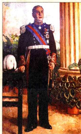
徐悲鸿之作汤姆斯爵士画像迄今仍悬挂于新加坡国家博物馆内。

徐悲鸿这幅新加坡第十九任总督汤姆斯爵士画像，迄今仍悬挂于新加坡国家博物馆内供人瞻仰。